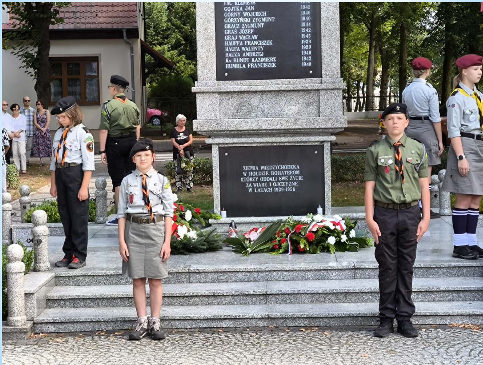
15.08.2024 r. Święto Wojska Polskiego - asysta harcerzy