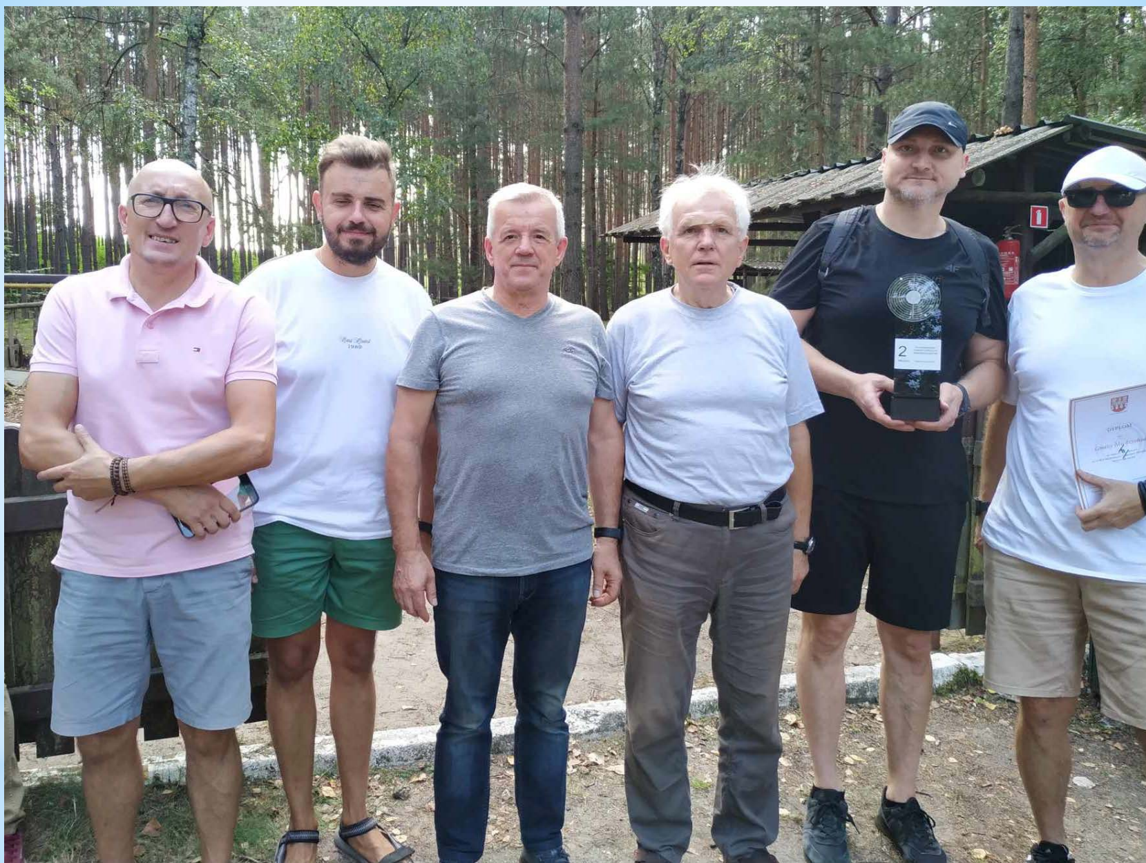
08.09.2024 r. Turniej Strzelecki Samorządowców Powiatu Międzychodzkiego. Drużyna RM Międzychodu