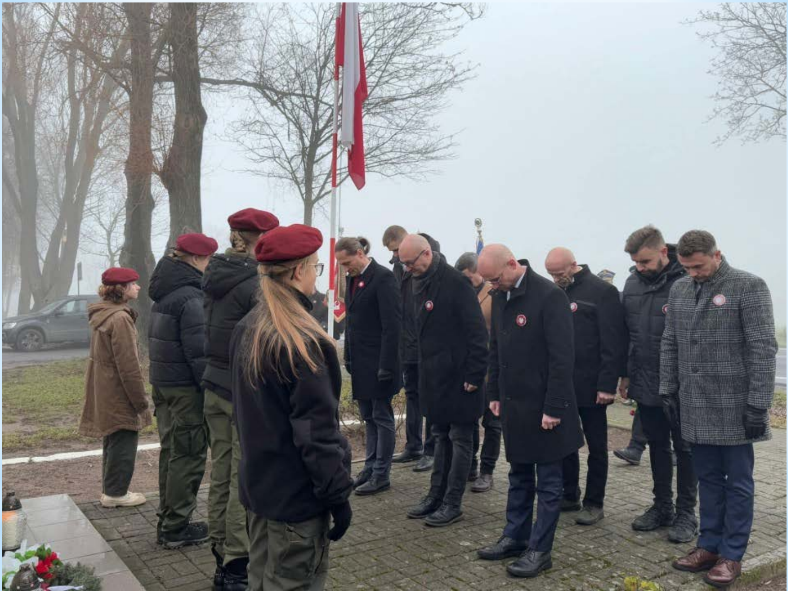
27.12.2024 r. rocznica Wybuchu Powstania Wielkopolskiego - pokłon Bohaterom