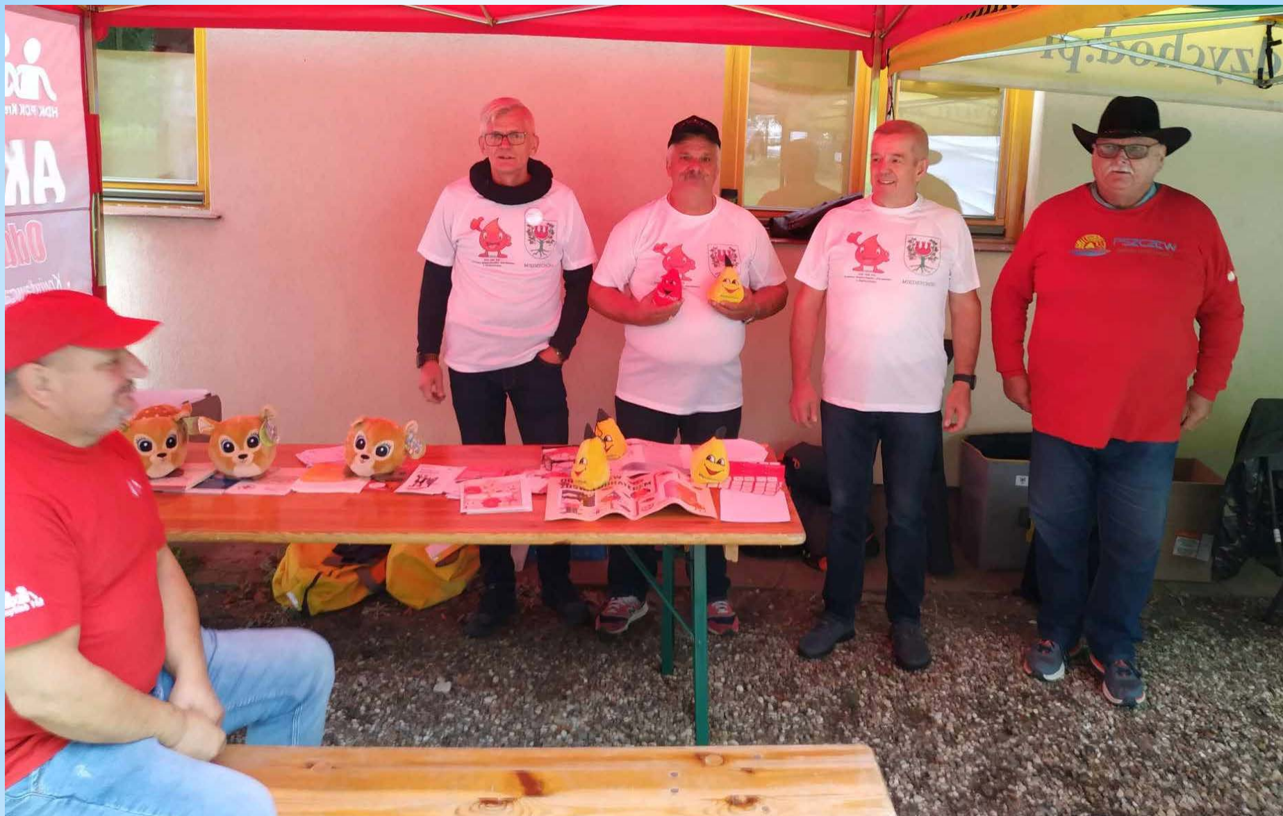
15.09.2024 r. Smażenie Powideł i promocja Honorowego Krwiodawstwa