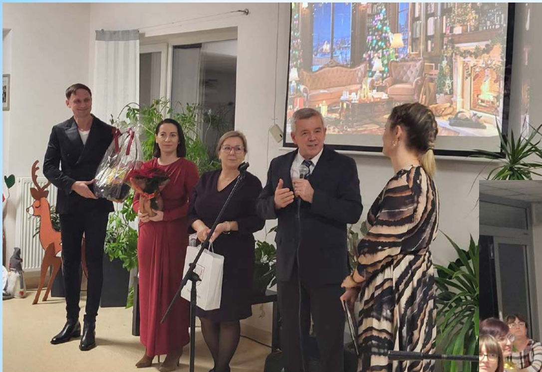
19.12.2024 r. Wigilia w ŚDS w Międzychodzie