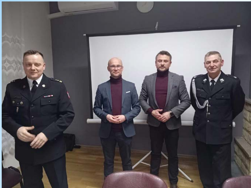
21.12.2024 r. Narada szkoleniowa i wigilia Międzychodzkich strażaków OSP