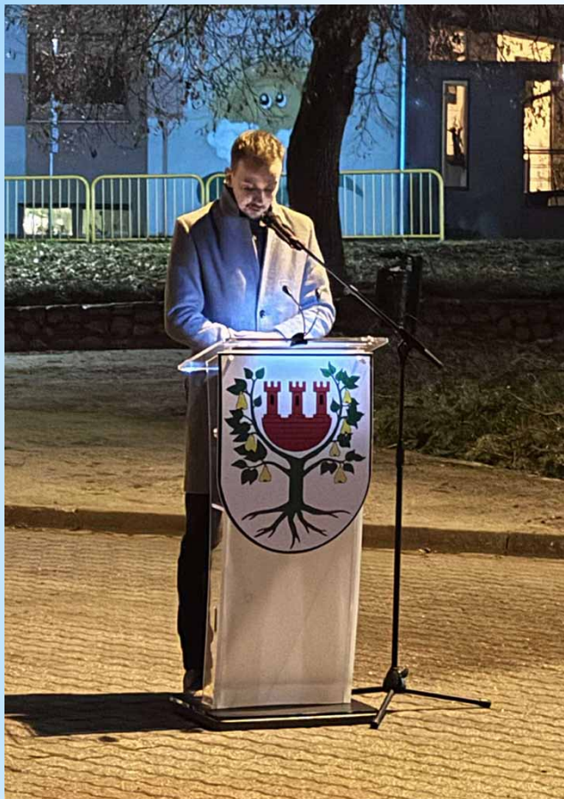
12.12.2024 r. rocznica wysiedlenia mieszkańców Międzychodu