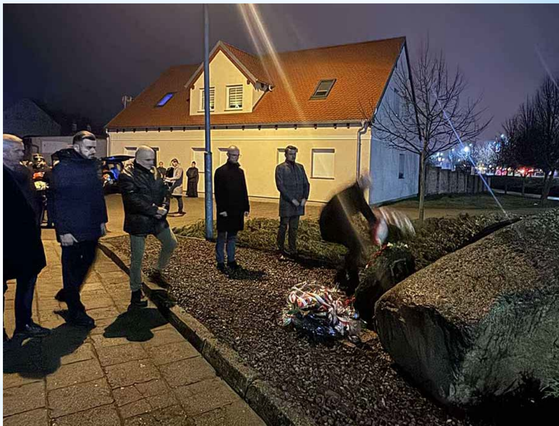
12.12.2024 r. rocznica wysiedlenia mieszkańców Międzychodu - złożenie kwiatów przy Pamiątkowym Kamieniu