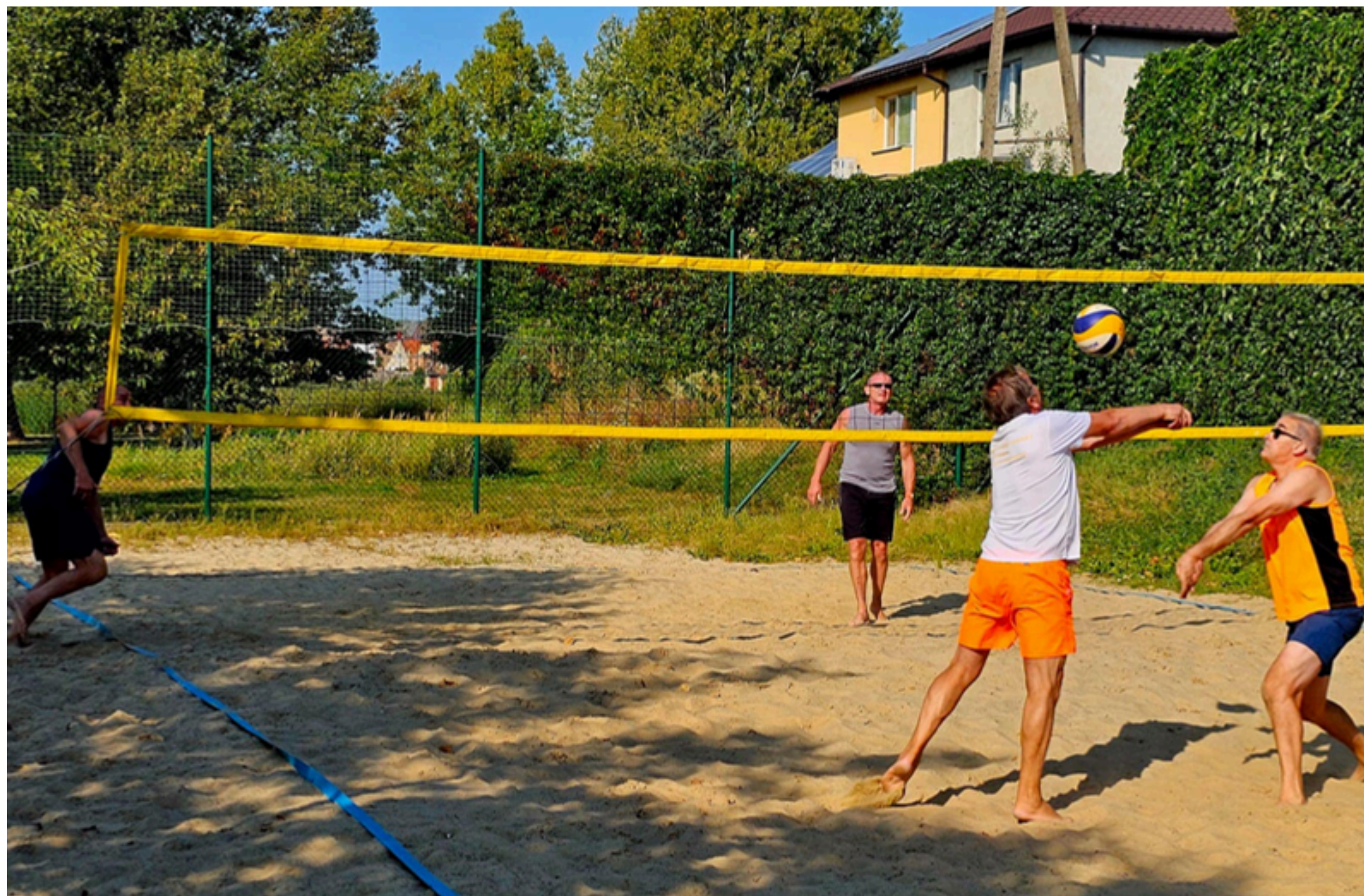
Turniej w Siatkówce Plażowej o Puchar Starosty Międzychodzkiego