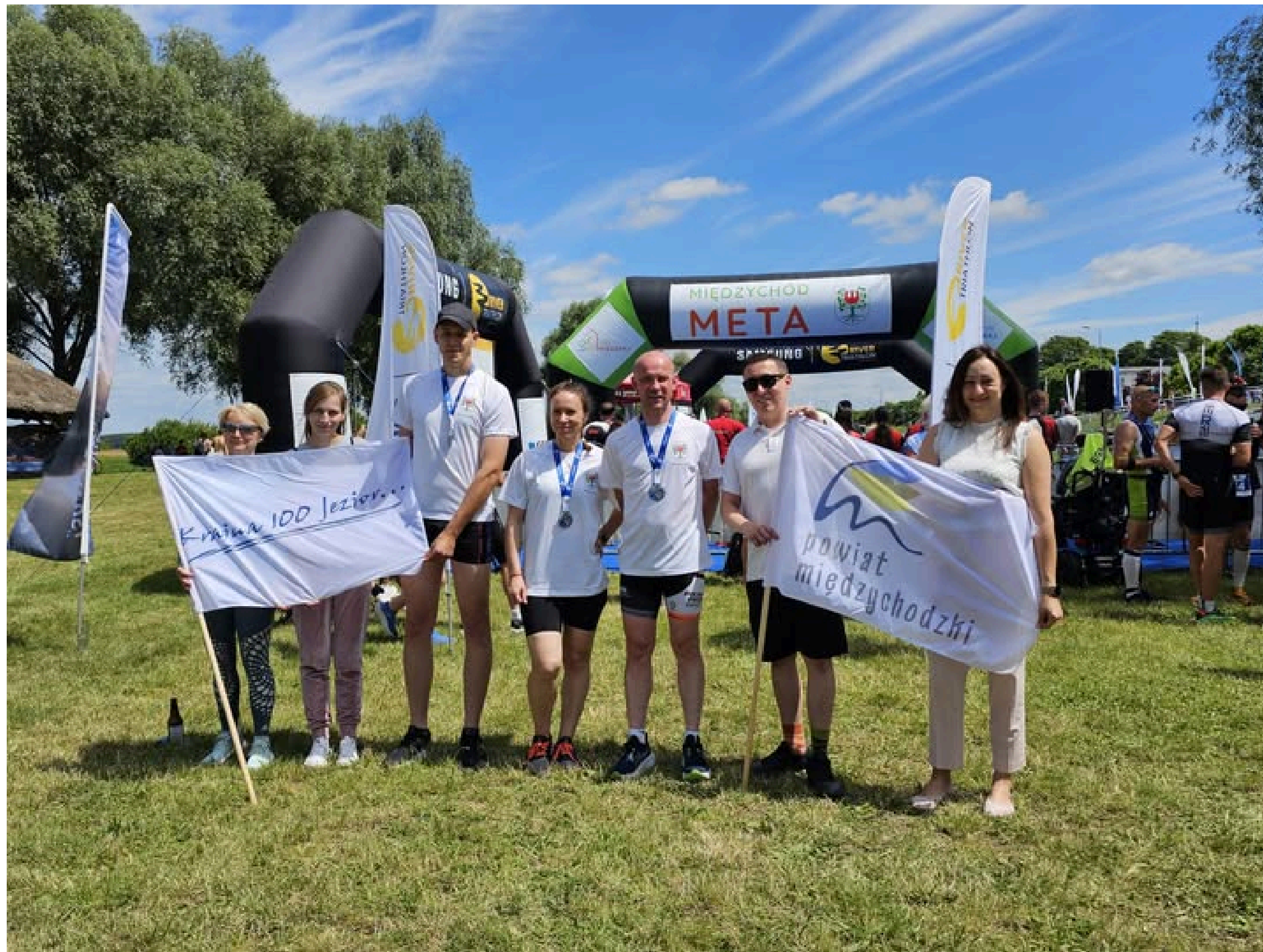
Samsung River Thriathlon Series