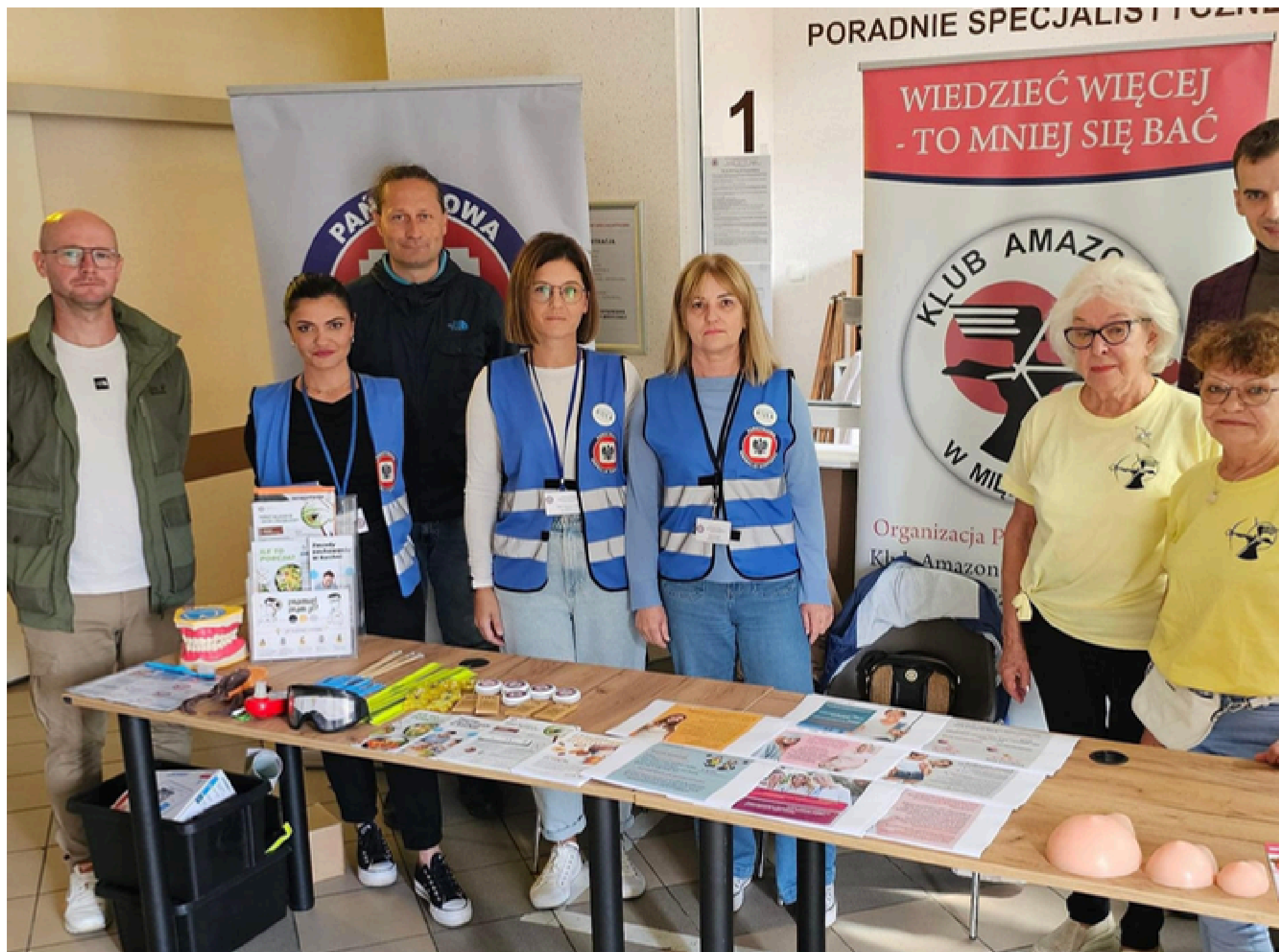
III Biała Sobota