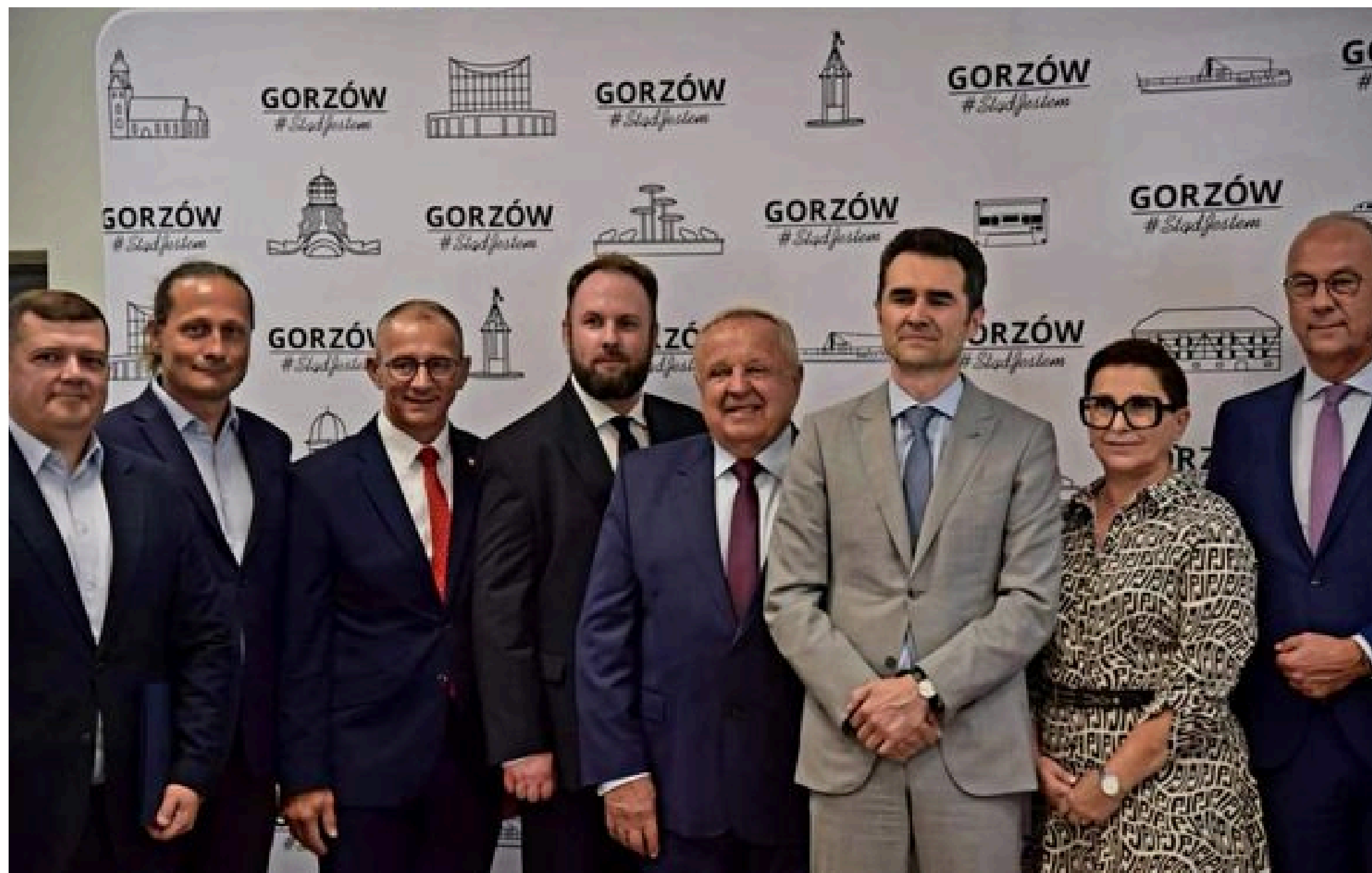
Spotkanie z Wiceministrem Infrastruktury Piotrem Malepszakiem dotyczące kolei