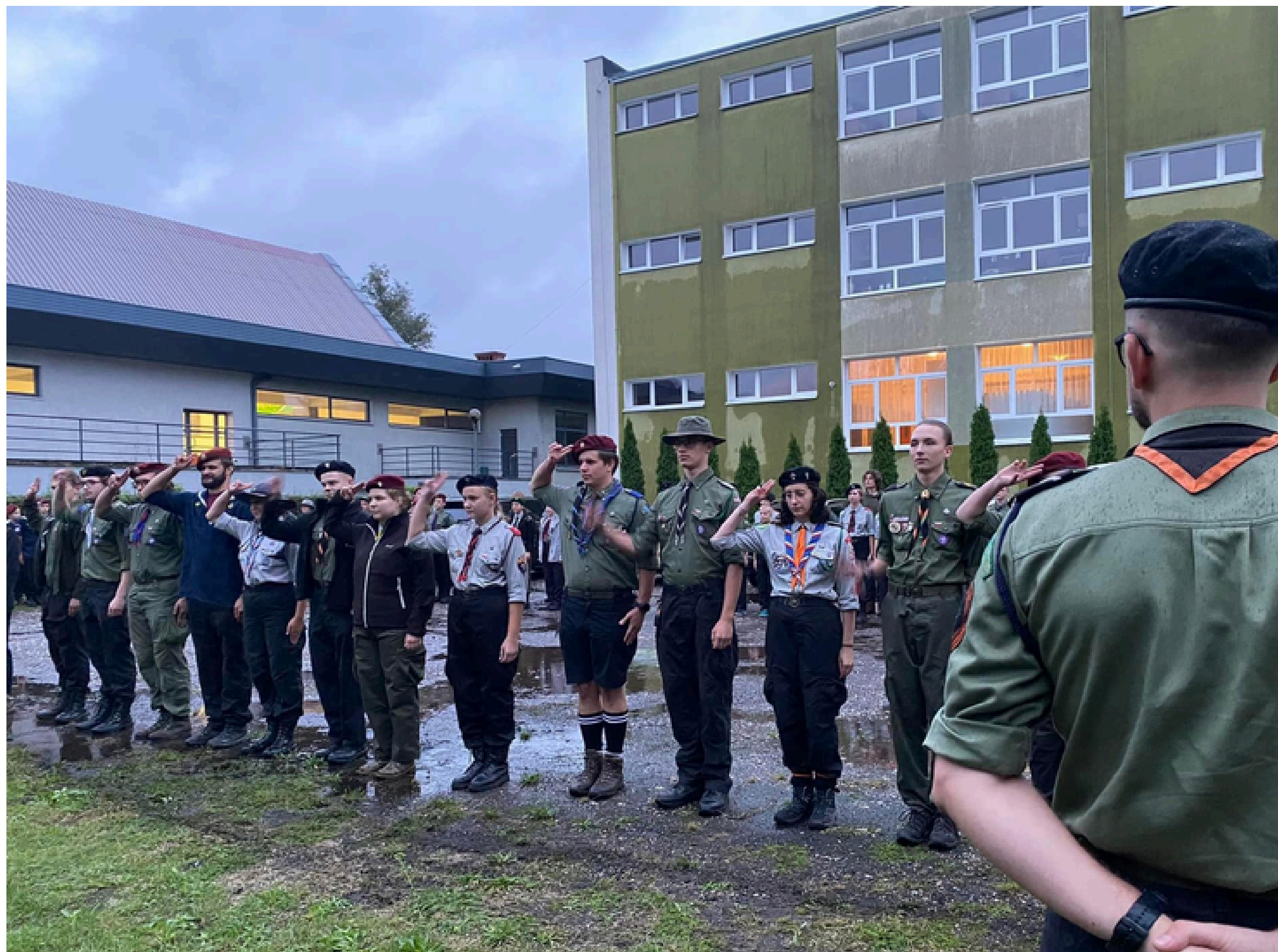
Rajd Harcerski “Zapałka’18”