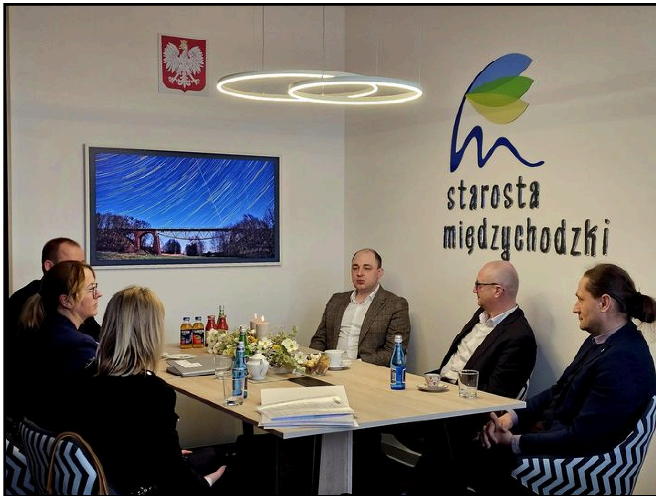
Spotkanie z Prezesem Christianapol Meble Polska w sprawie utworzenia klasy patronackiej w Zespole Szkół Nr 2