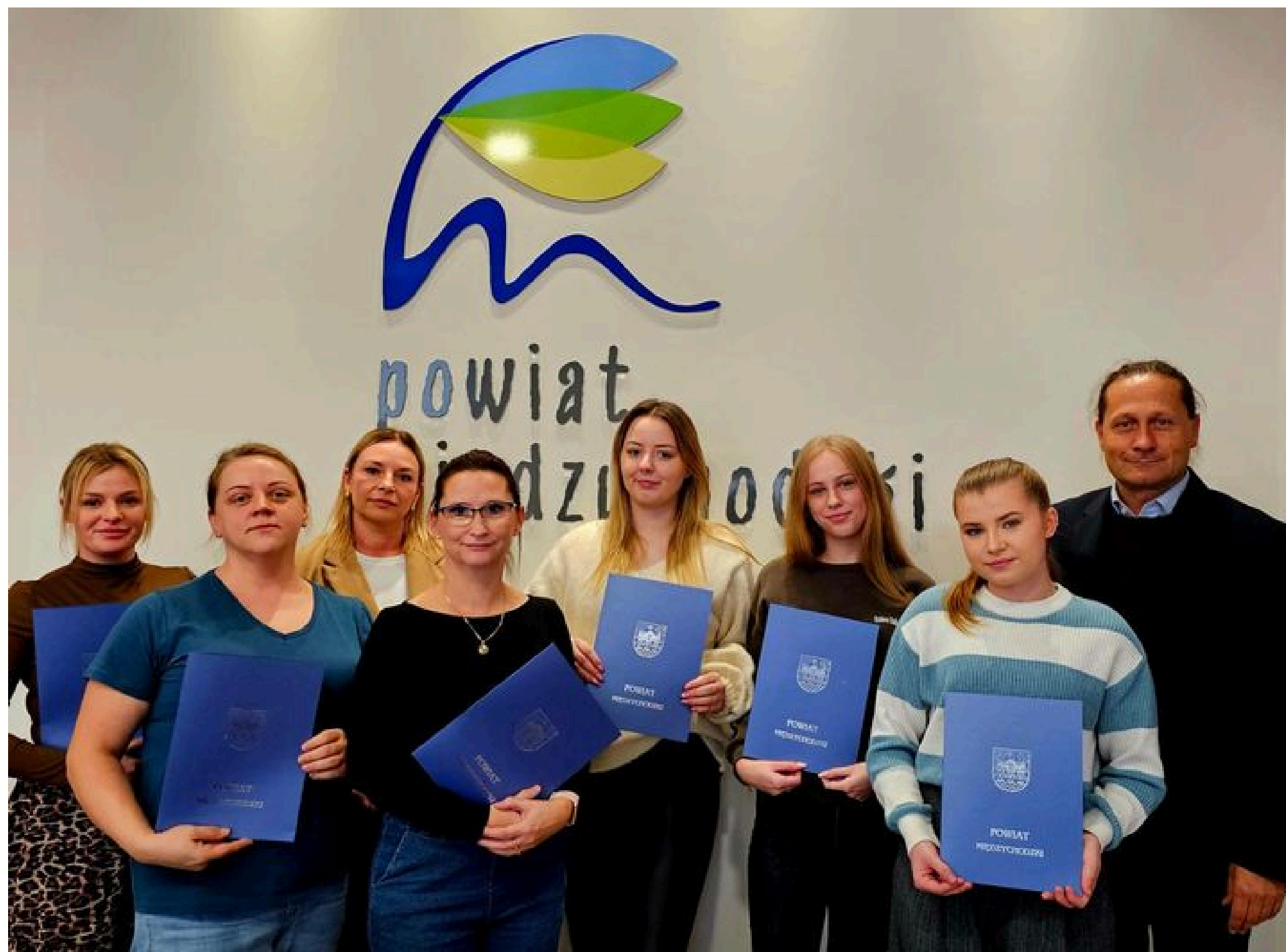
Stypendia dla pielęgniarek