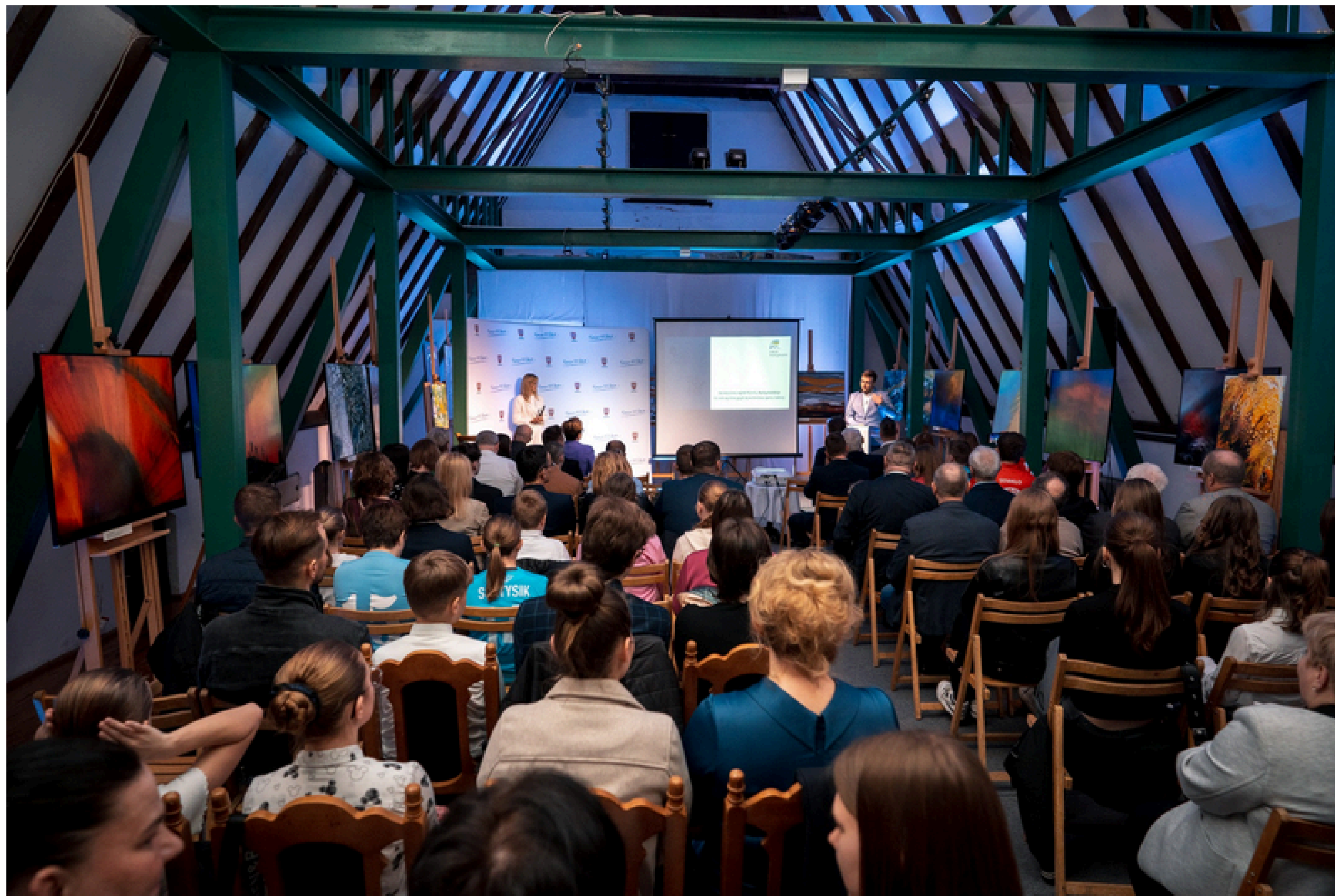
Gala Wręczenia Nagród Starosty za Wybitne Osiągnięcia w Dziedzinie Sportu i Kultury