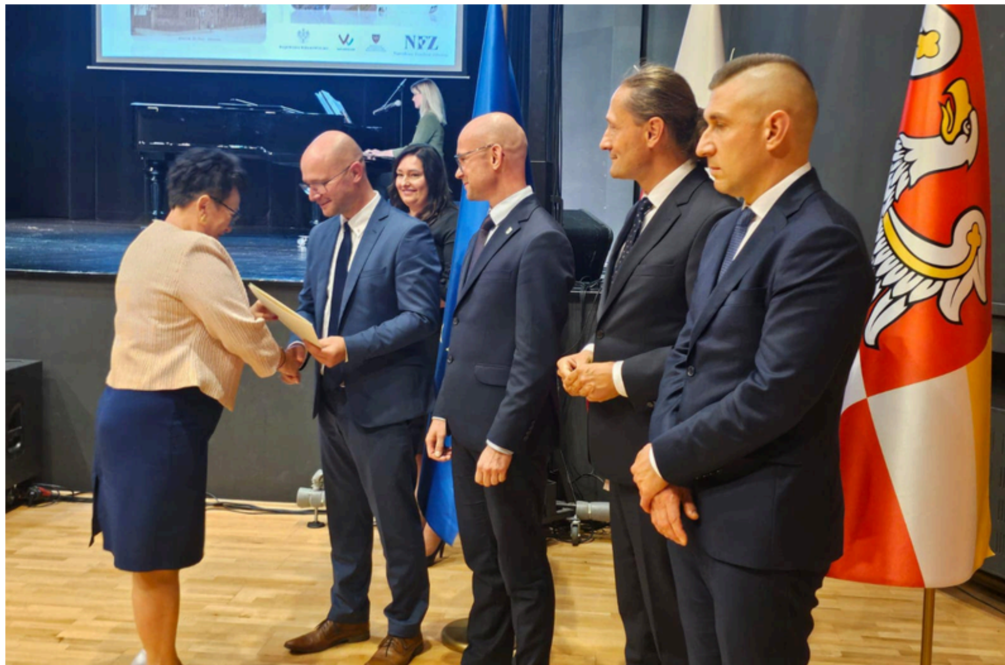
Jubileusz 120 - lecia Szpitala Powiatowego w Międzychodzie