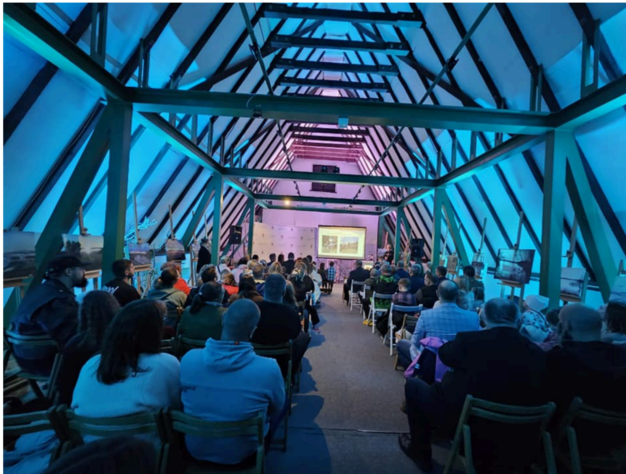
Gala podsumowująca VII Grand Prix Powiatu w biegach Dziecięco-Młodzieżowych