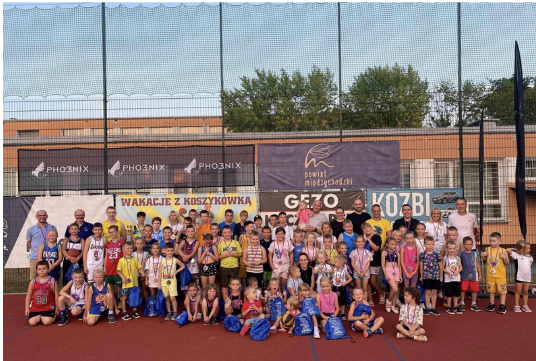
Wakacje z Koszykówką