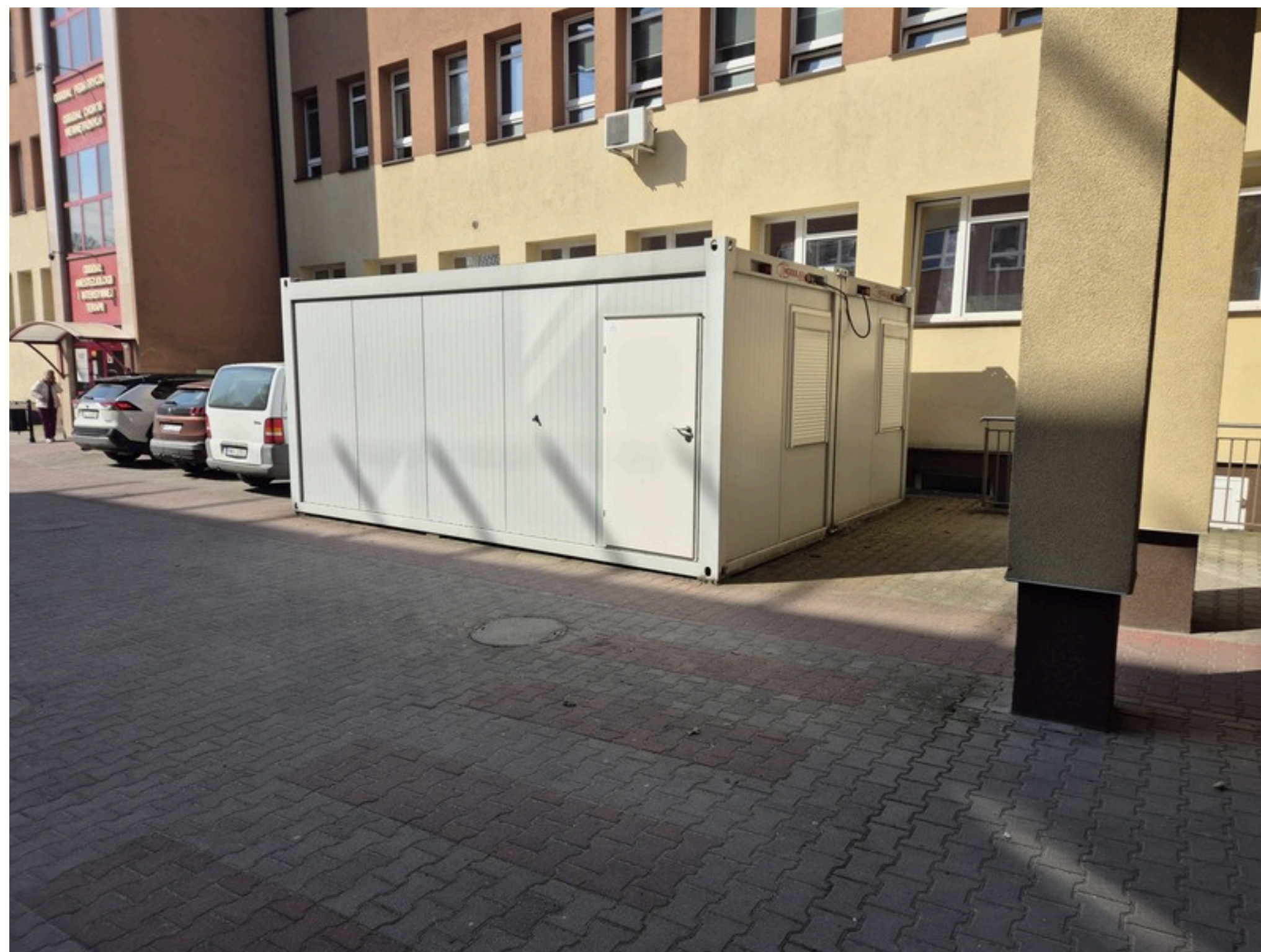
Kontenery - tymczasowy punkt pobrań